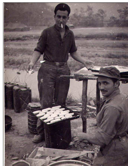
Les boulangers à l'oeuvre

Le matin nouveau tir aux armes lourdes ; l'après-midi repas et le soir manœuvre de nuit.