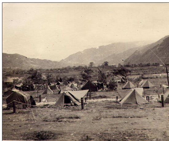
Le campement d'Inje