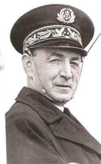
Amiral Thierry d'Argenlieu